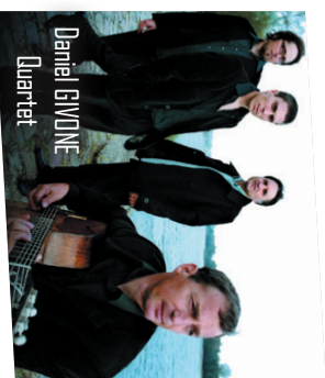
© Ronan de Mary de Longueville