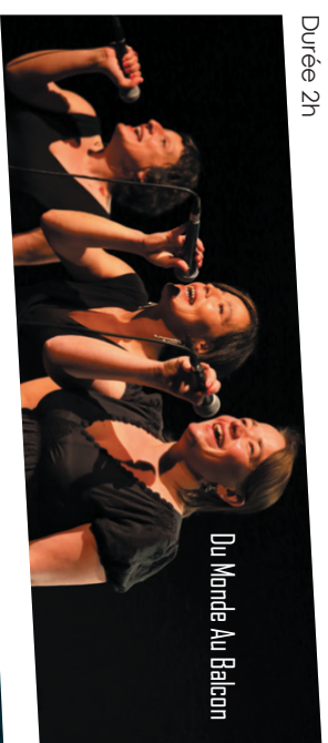
Du Monde Au Balcon